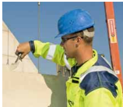
Sorgfalt und Genauigkeit sind gefragt: Ein Mitarbeiter auf einer Baustelle von NCC beim Mauern.