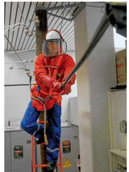
Sportlich muss man auch sein: ein Azubi trainiert das Arbeiten unter Spannung.

Auch Studenten/innen und Hochschulabsolventen/innen eröffnet der Energieversorger interessante Chancen. In Zusammenarbeit mit der Hochschule für Wirtschaft und Recht in Berlin bietet E.ON edis die Dualen Studiengänge Angewandte industrielle Elektrotechnik (Bachelor of Engineering) und Wirtschaftsinformatik (Bachelor of Science) an. Für studierte Ingenieure und Betriebswirte gibt es die Möglichkeit, über ein Trainee-Programm im Unternehmen einen Berufseinstieg zu schaffen.