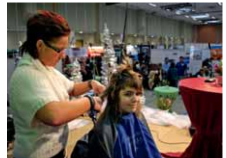
Bühnenreif: die Frisurenspezialisten haben ihr Können auch schon bei der Ausbildungsbörse gezeigt.

zum/r Friseur/in lernen sie alles über die Gestaltung von Frisuren, Haarpflege, -farbe und -schnitt. Aber auch Bärte wollen rasiert und geformt werden. Darüber hinaus gehört auch die Gesichts-, Hand-, und Nagelpflege zur Ausbildung. Angehende Friseur/innen sollten natürlich kommunikativ sein, denn eine gute Kundenberatung ist wichtig. Das Unternehmen mit 80 Mitarbeitern hat Salons in Fürstenwalde/Spree, Bad Saarow, Berlin, Briesen und Heinersdorf.